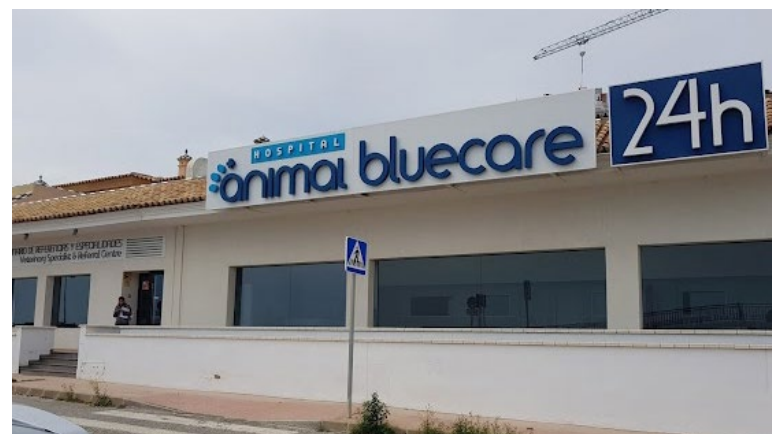
Hospital Veterinario Bluecare Sede Taller 1, 3 y 4