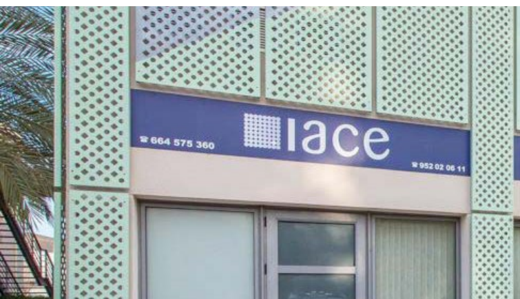
Formació IACE Sede Taller 2