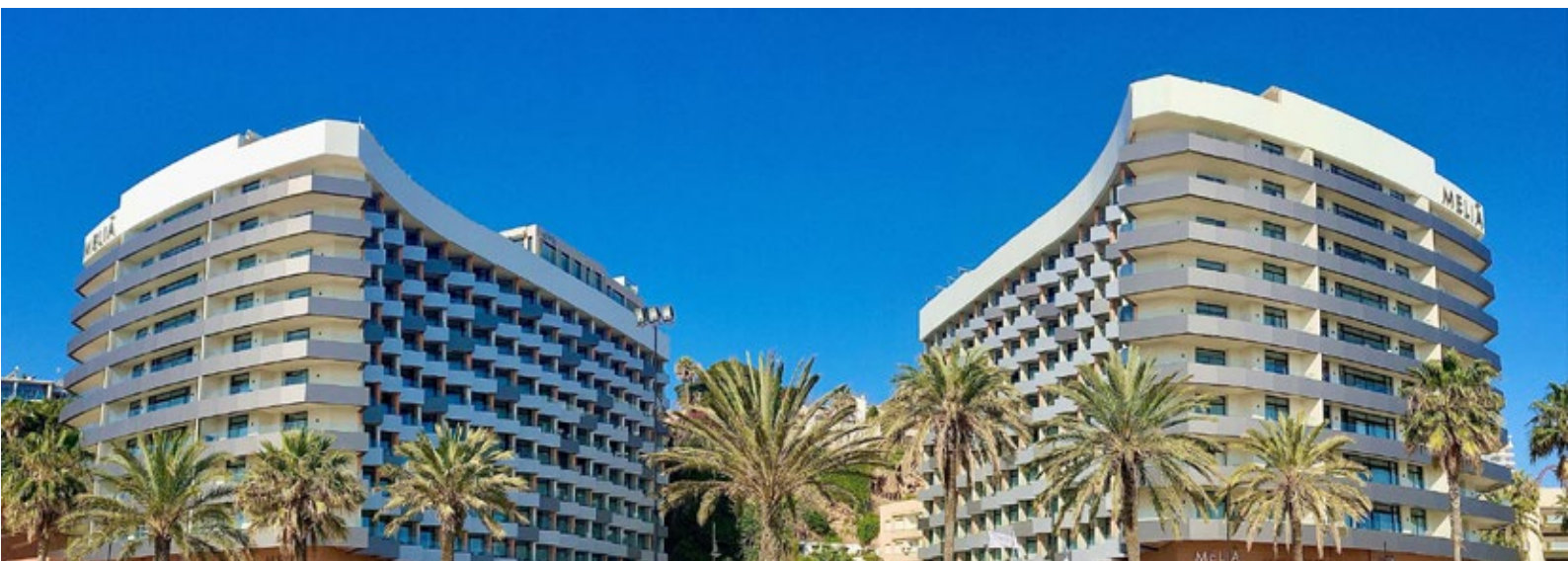
Hotel Meliá Costa del Sol Sede Seminarios, Congreso y Alojamiento

Hospital Veterinario Bluecare una de las principales características son sus amplias instalaciones, las cuales albergan todo el equipamiento preciso para cada especialidad, sin limitaciones de espacio. Ello permite que la ubicación de cada elemento técnico sea la más adecuada para facilitar el trabajo de los profesionales veterinarios.